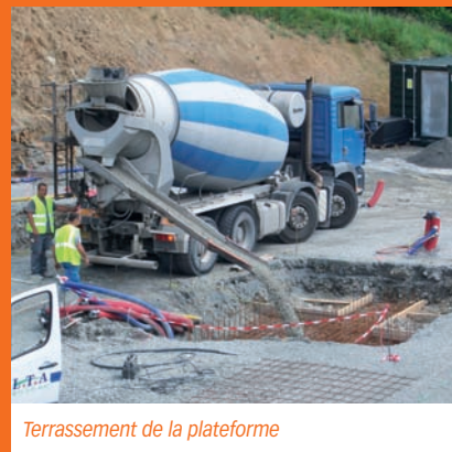
Terrassement de la plateforme

que ces installations n'augmenteront pas le niveau de bruit ambiant au niveau des habitations les plus proches. Ainsi un moteur d'une puissance d'1 MW va être mis en place, permettant de produire 5 900 MWh/an d'électricité, soit la consommation électrique hors chauffage de 1200 foyers. La chaleur produite par ce moteur servira à chauffer les locaux, voire même le centre de tri VAL'AURA voisin. Cette installation sera opérationnelle dès le mois d'octobre 2010.