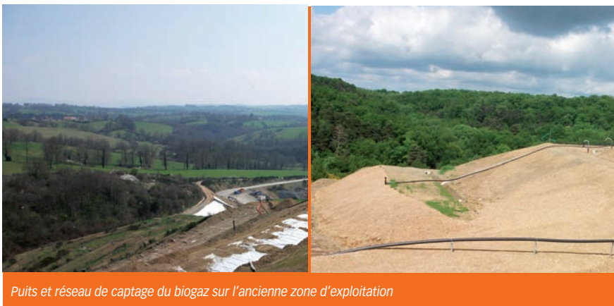
Puits et réseau de captage du biogaz sur l'ancienne zone d'exploitation

Enfin, la seconde campagne d'ensemencement de l'ancienne zone d'exploitation a été réalisée en mai. Les plantations arbustes seront réalisées en octobre, avec la mise en place du sentier pédagogique en collaboration avec la Ligue de Protection des Oiseaux (LPO) et France Nature Environnement.