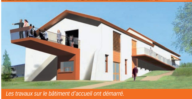
Les travaux sur le bâtiment d'accueil ont démarré.

Les installations d'accueil vont également être aménagées. Le bâtiment existant, déjà réhabilité sur la partie administrative, sera doté d'une salle d'interprétation à vocation pédagogique. L'activité du site y sera présentée et les visiteurs pourront bénéficier du panorama sur le site en se rendant sur le belvédère qui fera face à l'exploitation.